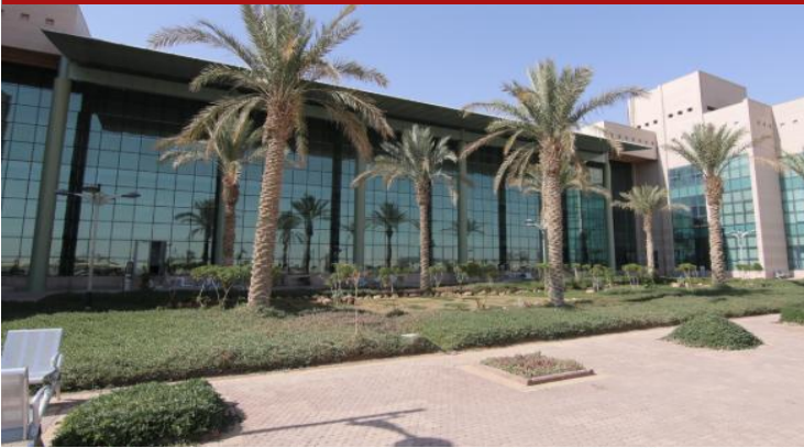
Almajmaa University - Alzolfy