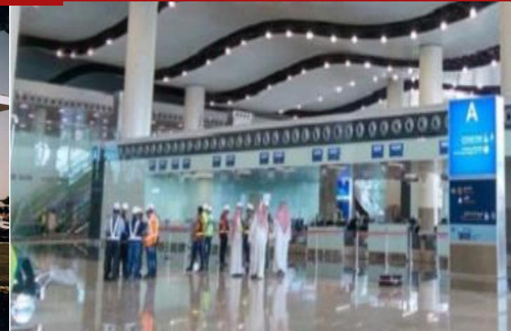
King Khaled International Airport