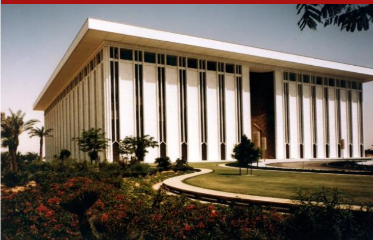
Saudi Central Bank