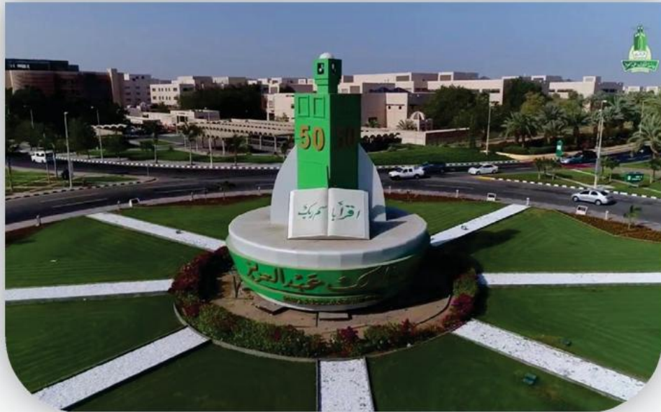
جامعة الملك عبد العزيز-رابغ King Abdulaziz University, Rabigh