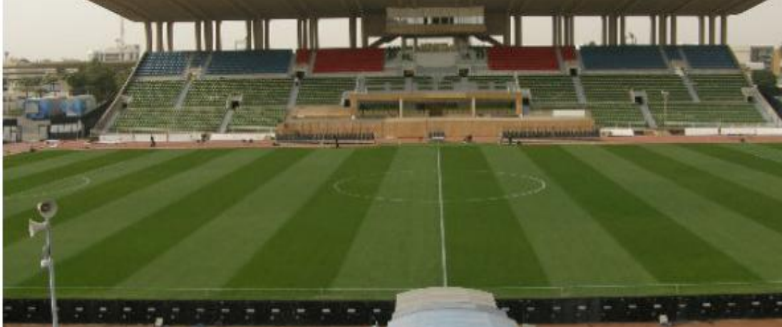
King Abdullah Sports City Qassim