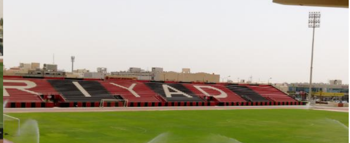
Riyadh Sports Club