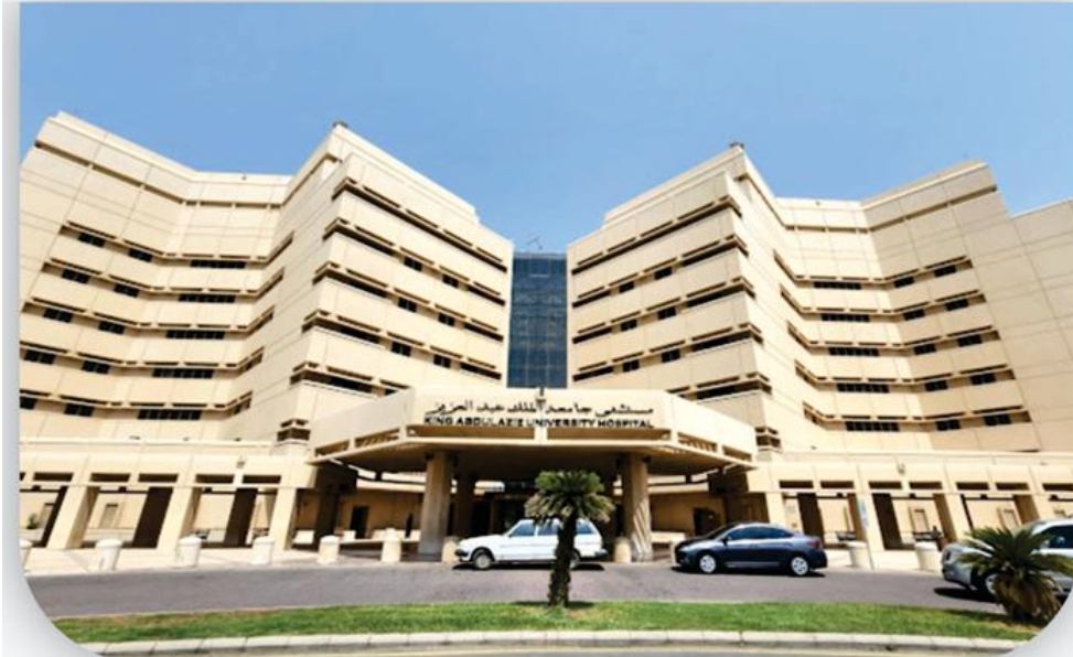
صيانة و تشغيل و نظافة المركز الطبي King Abdul Aziz Medical Center