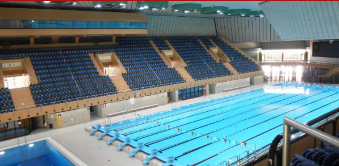
Sports Centre Jeddah