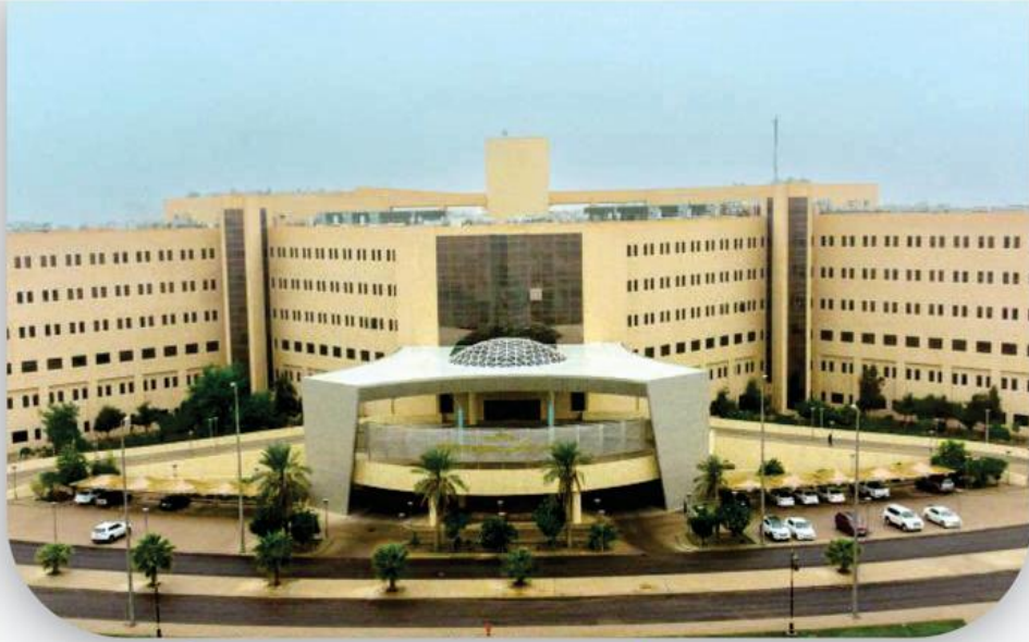
جامعة القصيم - القصيم Al Qassim University - Qassim